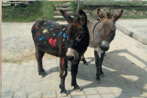
JEREMIAH & PEPPINO