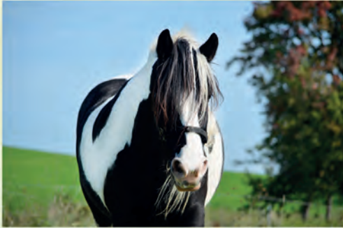
LANCELOT DU LACK